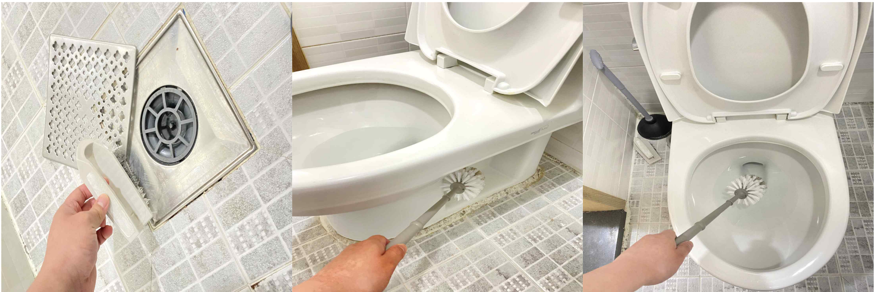
타일 및 타일 사이 때, 배수구 이물질 , 변기 내·외부 청소