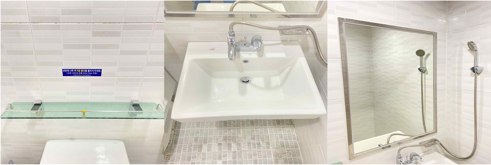
선반, 세면대, 거울 얼룩 제거